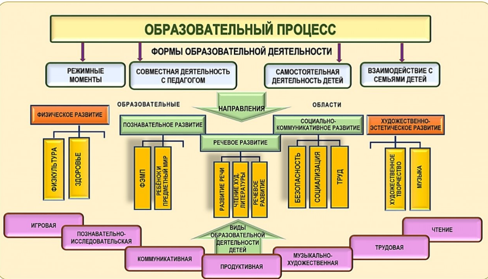
Модель организации учебно-воспитательного процесса в МБДОУ Тацинского д/с «Колокольчик» на день.